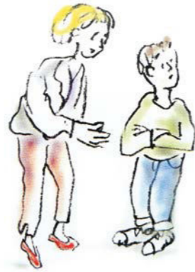
Er stellt keinen Blickkontakt her.