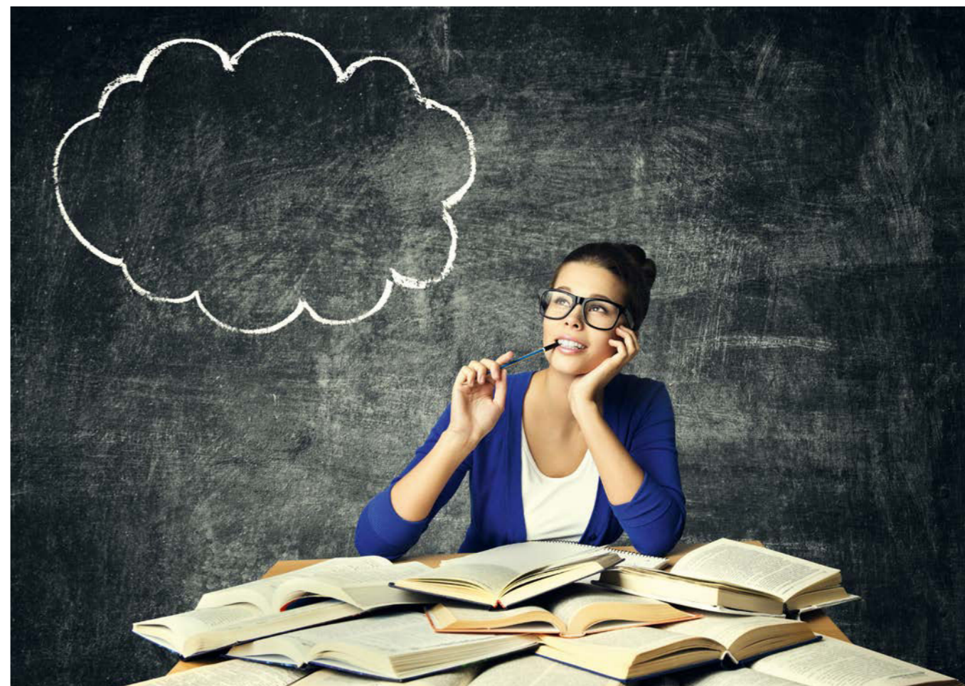
Scheitern oder Neuanfang: Es gibt ein Leben nach der Uni.

An den deutschen Hochschulen bricht Schätzungen zufolge fast jeder Dritte sein Studium ab. Ein Massenphänomen, das auch vor der Goethe-Universität nicht Halt macht. Studienzweifler und Studienabbrecher können sich hier von der Zentralen Studienberatung Unterstützung für die Neuorientierung holen. Mehrere Beraterinnen und Berater helfen, doch noch einen Weg zu einem Studienabschluss oder den Ausstieg aus der Uni und Alternativen zu finden. Es gibt berufliche Angebote explizit für Studienabbrecher.