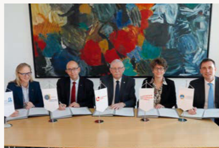
Vertragsunterzeichnung der Hochschulallianz »TruMotion«

»Politics, Economics and Law« mit einem Informatikanteil, der auch zwei Auslandsaufenthalte beinhaltet. Zudem sollen neue Lehrformate entwickelt werden, die nicht immer einen Ortswechsel erfordern. Und auch die Beschäftigten in Wissenschaft und Verwaltung können sich künftig miteinander austauschen und die Arbeitsweisen und Strukturen an anderen Hochschulen kennenlernen. Langfristig ist auch eine gemeinsame technische Infrastruktur geplant. Um diese Ziele finanzieren und umsetzen zu können, bewerben sich die fünf Universitäten gemeinsam um den Titel »Europäische Universität« und damit um Fördermittel der Europäischen Union. ■