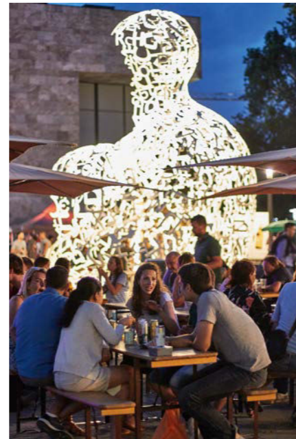
Immer einen Besuch wert: Sommerfest auf dem Campus Westend der Goethe-Universität.