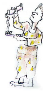
Er besteht auf Ritualen und Gewohnheiten.