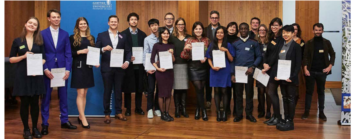
Neuankömmlinge an der Goethe-Universität: Studierende des Masterstipendienprogramms »Goethe Goes Global« während der Vergabefeier im Dezember 2019.

Internationalisierung von Studium, Lehre und Forschung