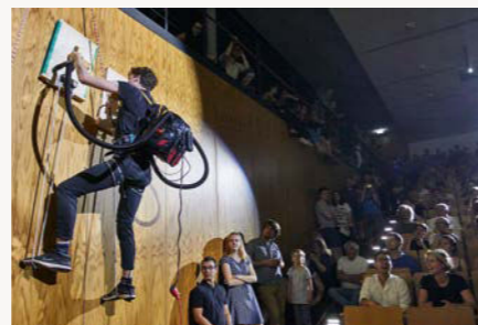
Physik spektakulär – Night of Science macht es möglich.

dabei. Eine ganze Nacht Chemie, Physik, Biowissenschaften, Psychologie, Geowissenschaften, Informatik. Das kommt an: Die Night of Science ist mittlerweile zum Publikumsmagneten avanciert. Zu Recht. Night of Science – Wissenschaft ganz anders. Auch 2020 wird es wieder spät. Am 19. Juni 2020 ab 17:00 Uhr bis 06:00 Uhr auf dem Campus Riedberg. ■