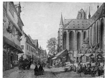
Mittelalterliches Frankfurt – Radierung von © Peter Becker

Kunstgeschichtliche Stadtführungen per App